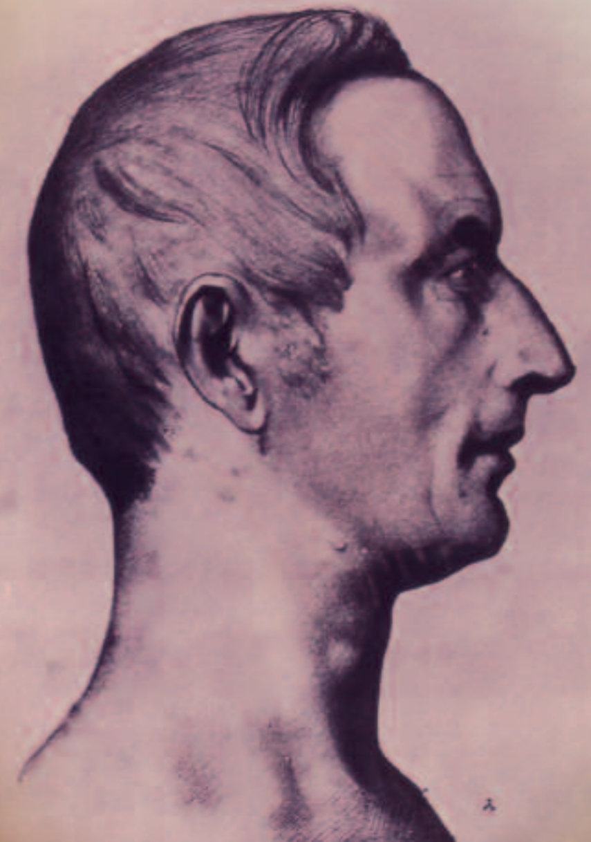
Portrait d'Alphonse de Lamartine (1790-1869).

Enfin, la France entrait alors dans une nouvelle phase de son histoire coloniale et les milieux coloniaux voyaient dans la mise en valeur agricole de l'Afrique du Nord, après la prise d'Alger, une solide alternative à l'abolition de l'esclavage dans les désormais "vieilles colonies".