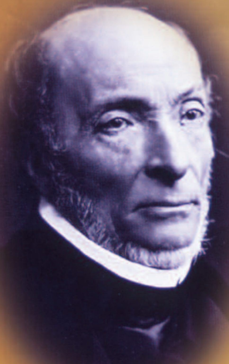
Portrait de Victor Schoelcher (1804-1893).

En moins de deux mois, le Gouvernement provisoire de la République Française imposa l'abolition de l'Esclavage sans aucune étape transitoire. Celle-ci fut proclamée le 27 avril 1848 et entra en application le 22 mai en Martinique, le 27 mai en Guadeloupe, le 10 juin en Guyane et le 20 décembre à la Réunion.