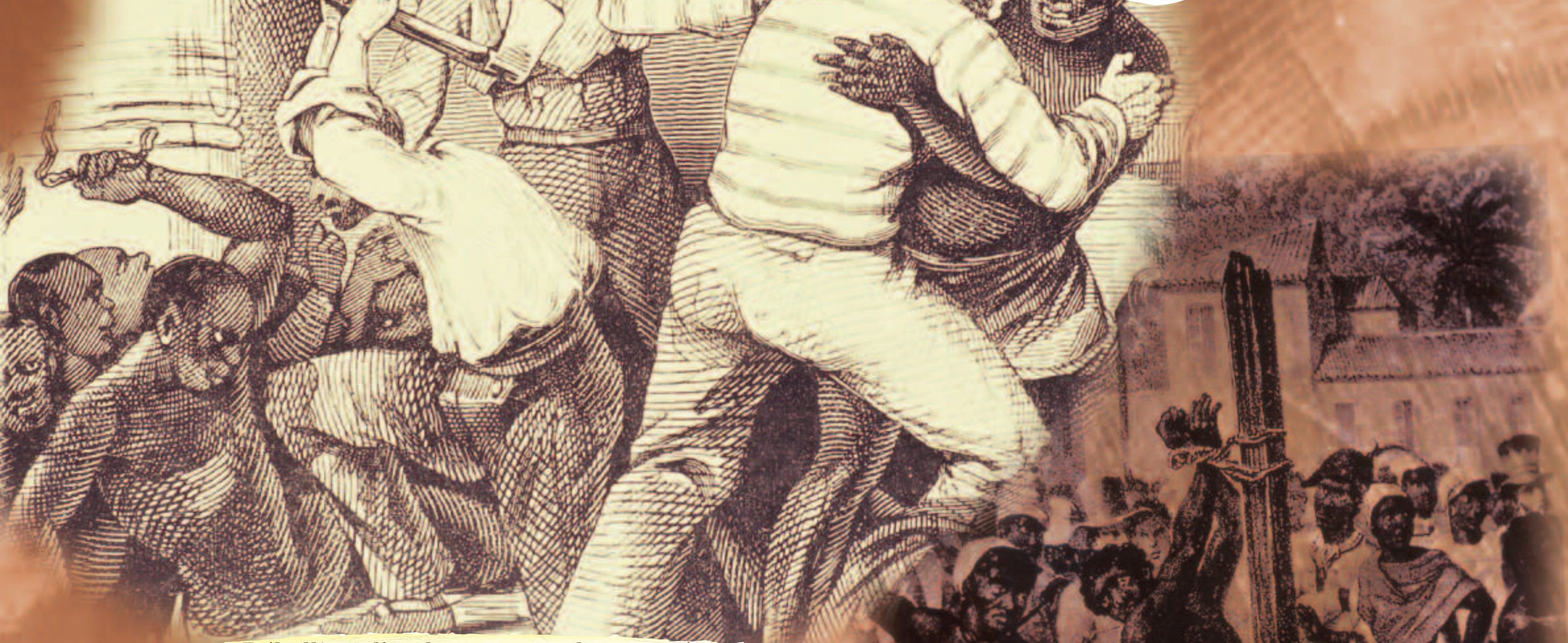
Rébellion d'esclaves sur un bateau négrier.

La première forme de résistance fut le "marronnage". L'esclave marron est un esclave fugitif et l'origine du mot marron est semble-t-il une déformation du mot espagnol "cimarron" qui veut dire "sauvage".