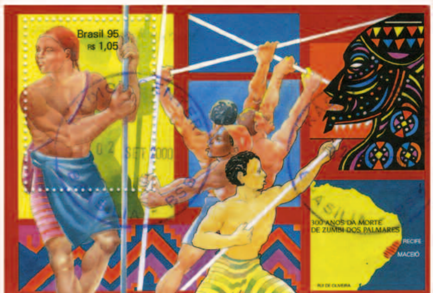
Hommage de la poste du Brésil pour le 300ème anniversaire de la mort de Zumbi dos Palmares (1655-1695).