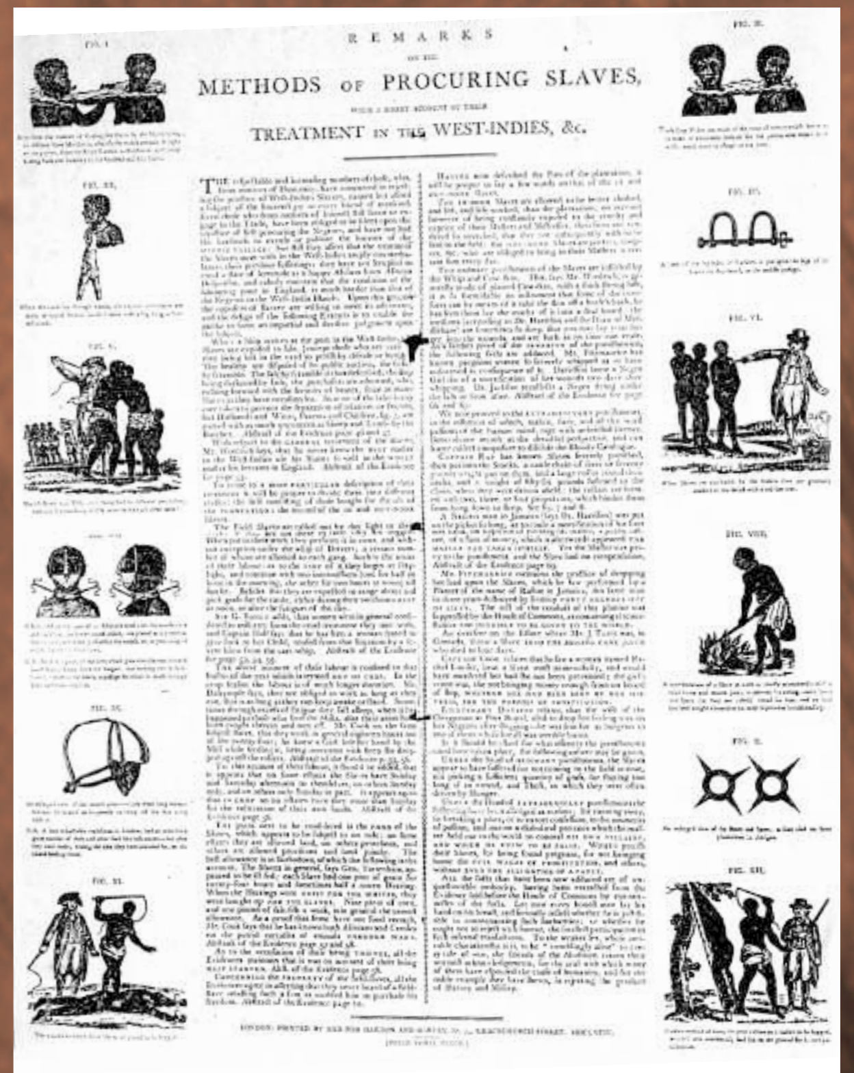
Châtiments et traitements prescrits aux esclaves.

C'est dans ce contexte qu'il fut nécessaire de codifier "la police des Nègres" destinée à encadrer juridiquement le comportement de l'esclave et les rapports entre maîtres et esclaves. Promulguée en 1685, cette législation, connue sous le nom de "Code Noir", imposait la religion catholique aux esclaves tout en leur apportant une protection minimale face à l'arbitraire des maîtres. Malgré de louables intentions, l'esclave n'avait pas de personnalité juridique propre, ne disposant pas de sa propre personne et ne jouissant d'aucun bien ou propriété. Ses enfants appartenaient au maître de leur mère.