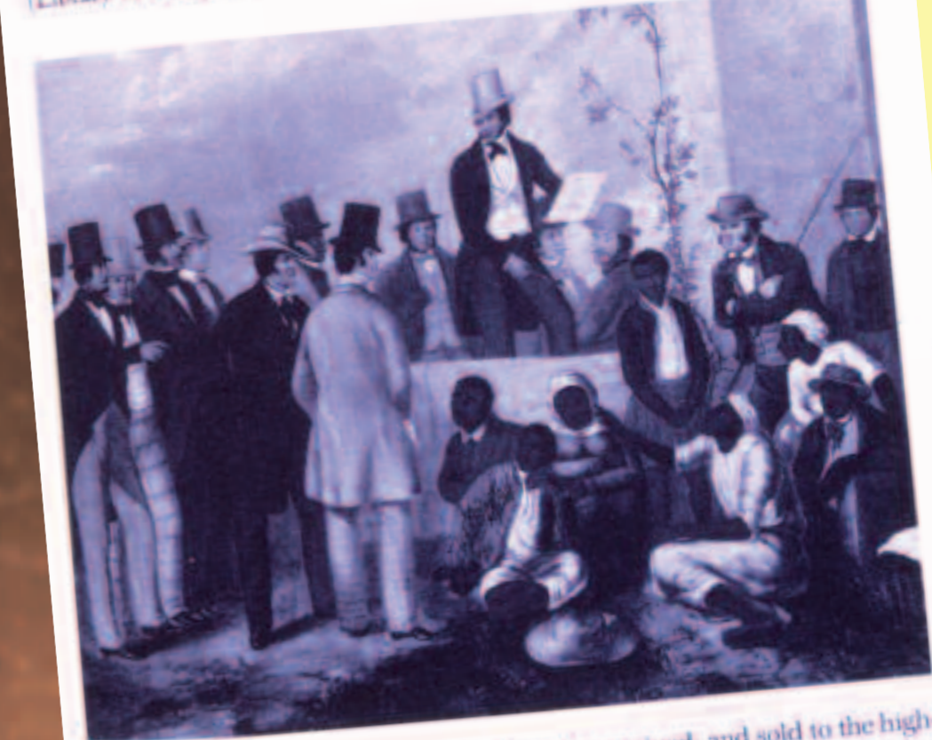
On the auction block, slaves were displayed, examined, and sold to the highest bidder. The bidders in this illustration are shown as men of high social standing in their formal dress and top hats.

Defined legally as chattel, an article of movable property, slaves were advertised as commodities, available for purchase in the antebellum South.