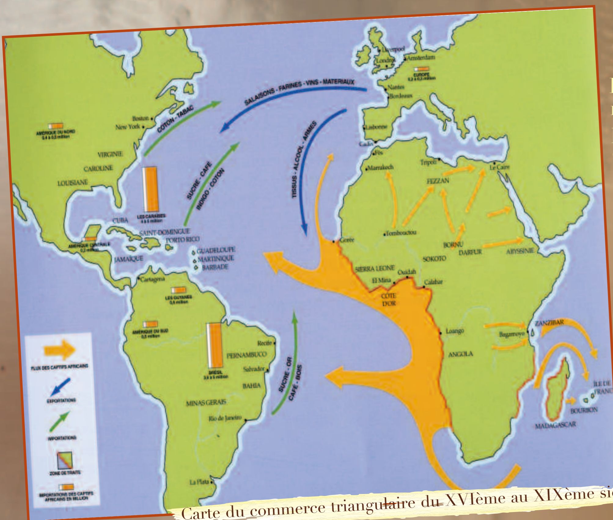
Carte du commerce triangulaire du XVIème au XIXème siècle.

L'Europe toute entière n'échappa pas à un redéploiement de ses circuits économiques : toutes les marchandises destinées à l'achat des esclaves (tissus, métaux, alcools, faïences...) étaient le produit des manufactures de l'Europe entière. Le commerce négrier n'était pas la seule affaire des ports mais ses ramifications remontaient jusqu'aux villes manufacturières de l'intérieur et au cœur des campagnes.