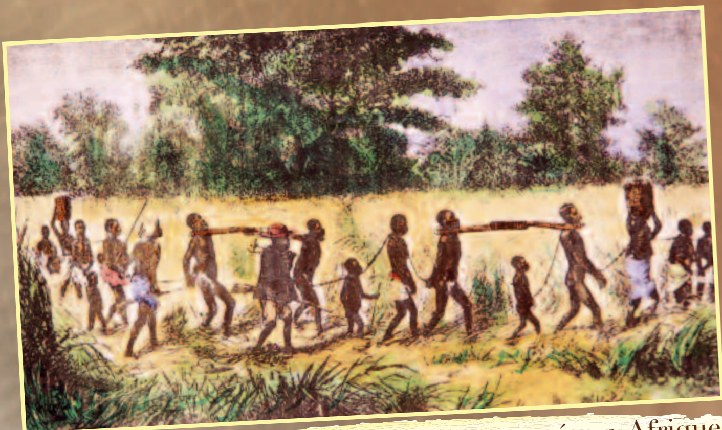
Convoi d'esclaves capturés en Afrique.

C'est de là que se mit en place le processus de la traite des Nègres, né de la dépopulation de l'Amérique et de l'avidité européenne pour l'exploitation de nouvelles richesses procurées par une nouvelle main d'œuvre servile importée d'Afrique, les tentatives de peuplement européen par des "engagés" ayant rapidement échoué.