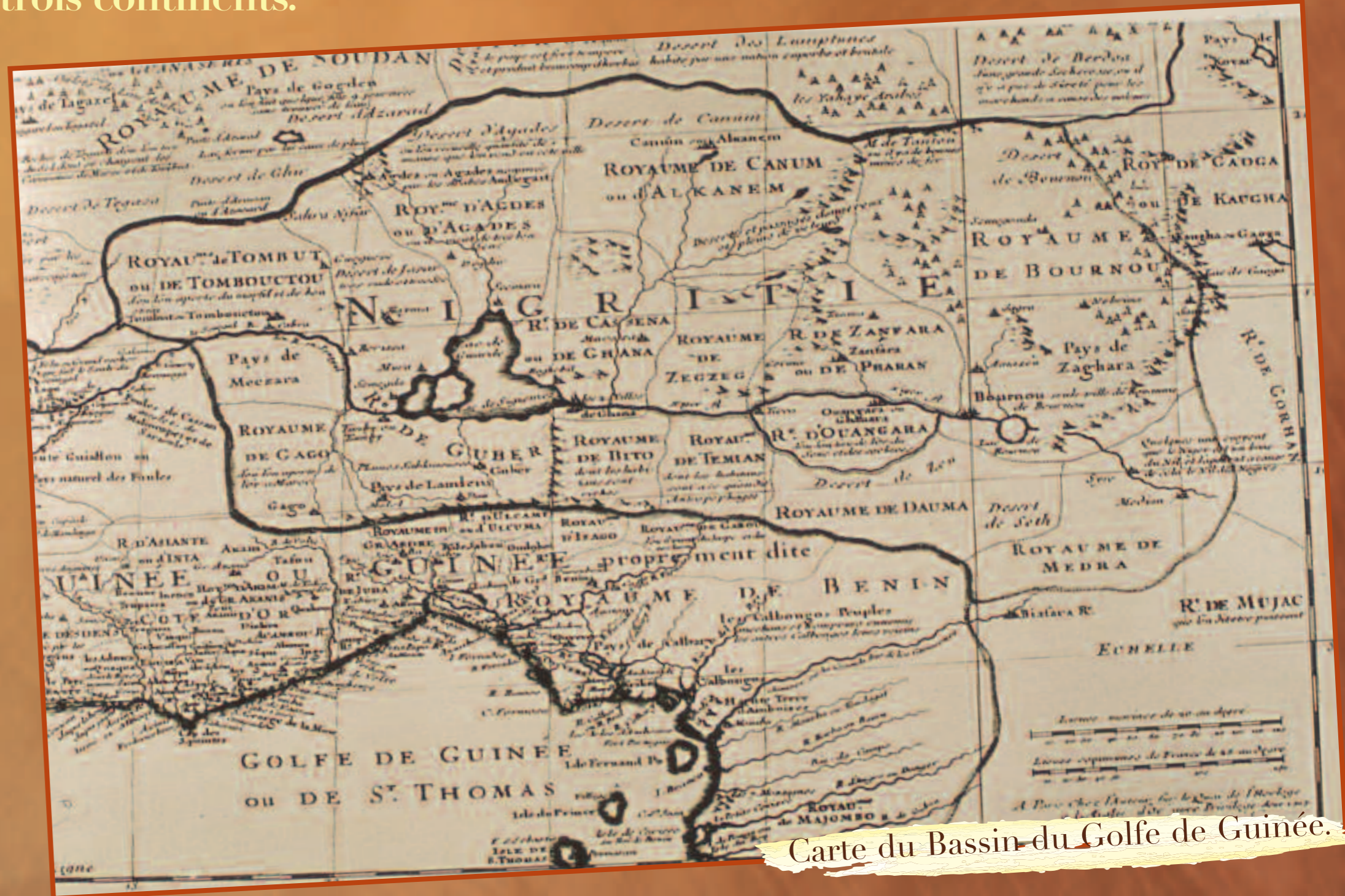
Carte du Bassin du Golfe de Guinée.

Pillée de ses richesses, l'Amérique fut le théâtre du premier grand génocide de l'Histoire moderne : en trois décennies la Caraïbe était vidée de ses habitants d'origine et le continent américain perdit, au cours des siècles suivants, les deux tiers de ses habitants issus de civilisations pluri-millénaires.