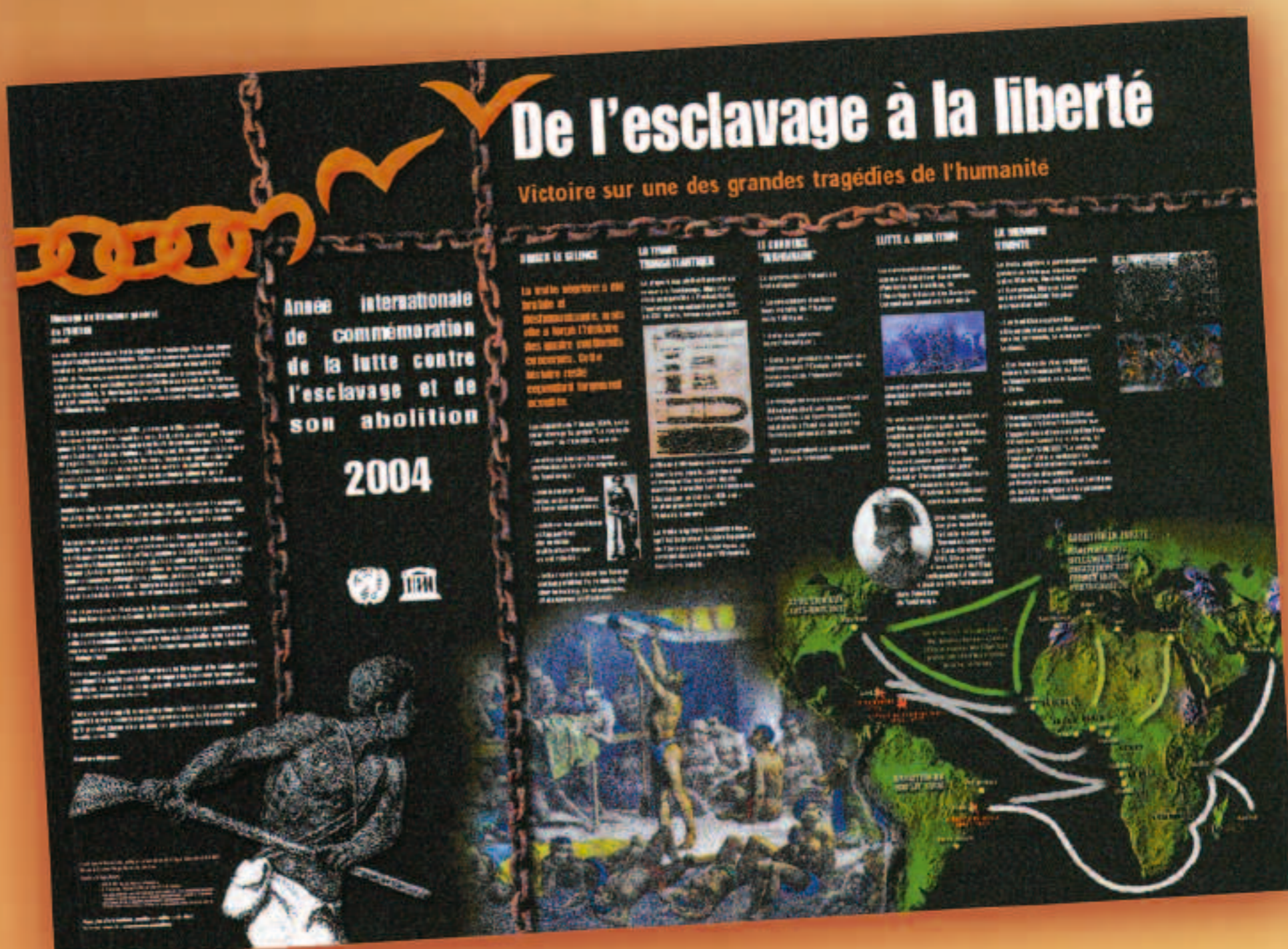
Affiche de 2004, année internationale de commémoration de la lutte contre l'esclavage et de son abolition.

Le projet a été à l'origine de la proclamation par les Nations Unies de 2004, "Année internationale de commémoration de la lutte contre l'esclavage et de son abolition".