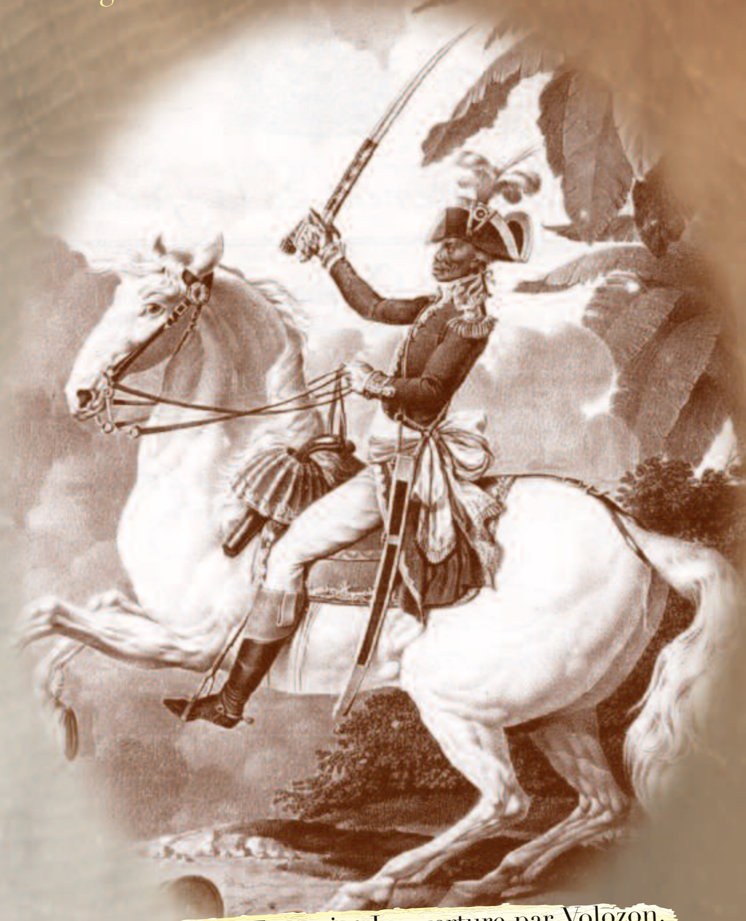
Portrait de Toussaint Louverture par Volozon.

Devenu leader emblématique de la seule insurrection d'esclaves victorieuse de l'Histoire, précurseur du mouvement d'émancipation des colonies indigènes et déclencheur du processus des abolitions de l'esclavage, Toussaint Louverture, première des grandes figures du pouvoir Noir, fut un modèle pour les futurs leaders des indépendances, pour les combattants pour l'obtention des droits civiques, pour les résistants contre l'apartheid ou pour les fondateurs du mouvement de la négritude.