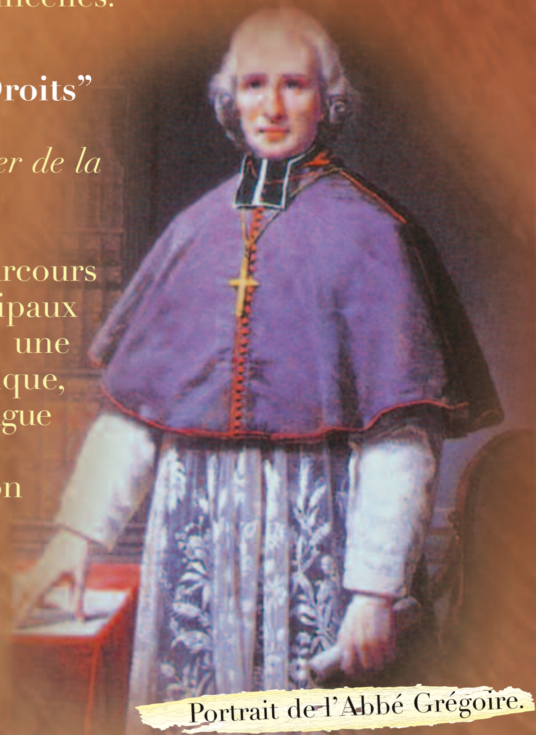
Portrait de l'Abbé Grégoire.

Emancipateur des Juifs et des Noirs, Grégoire, à côté d'un parcours politique exceptionnel faisant de lui un des fondateurs principaux de la République, le 21 septembre 1792, laissa à la France une œuvre considérable dans les réformes de l'instruction publique, de la sauvegarde du patrimoine, de l'universalisation de la langue française ou de l'encouragement des sciences et des arts. Mais c'est dans le domaine des Droits de l'Homme que son œuvre passa à l'immortalité et dans laquelle René Cassin, son lointain disciple, vint puiser pour élaborer la Charte Universelle des Droits de l'Homme que proclama l'Organisation des Nations Unies en 1948.