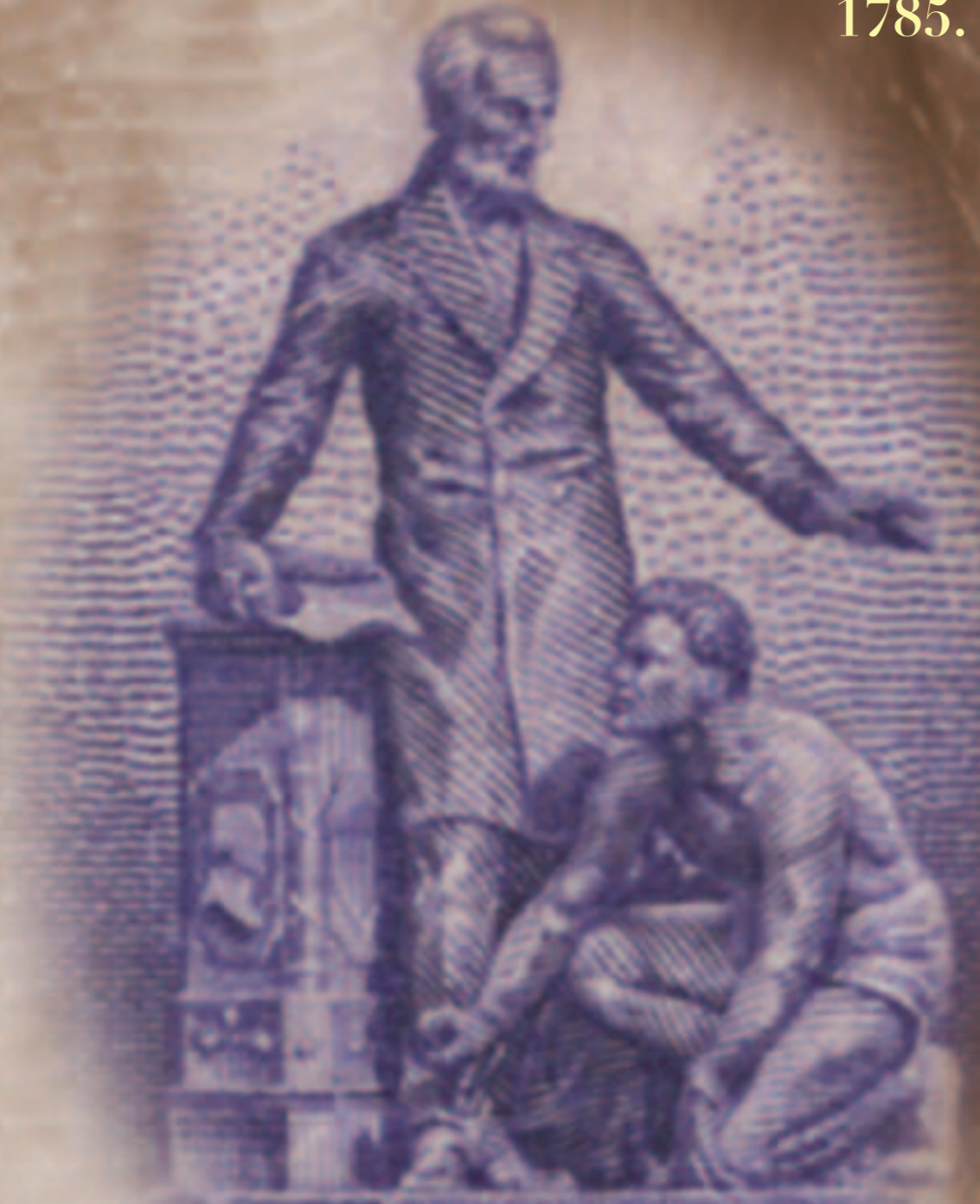
Abolition de l'esclavage aux Etats-Unis en 1865

Le journal abolitionniste "The Liberator" fondé en 1840 ou le roman "La case de l'Oncle Tom" paru en 1852, stimulèrent les adhésions aux sociétés abolitionnistes qui comptèrent jusqu'à deux cent mille membres. En 1860 l'élection à la présidence d'Abraham Lincoln, soucieux de "réunifier la maison" déclencha la guerre civile. Huit mois après la défaite du Sud, le 18 décembre 1865 le treizième amendement à la Constitution abolissait l'esclavage. En 1868 le quatorzième amendement accordait l'égalité civile aux Noirs et en 1870 le quinzième leurs octroyait le droit de vote.