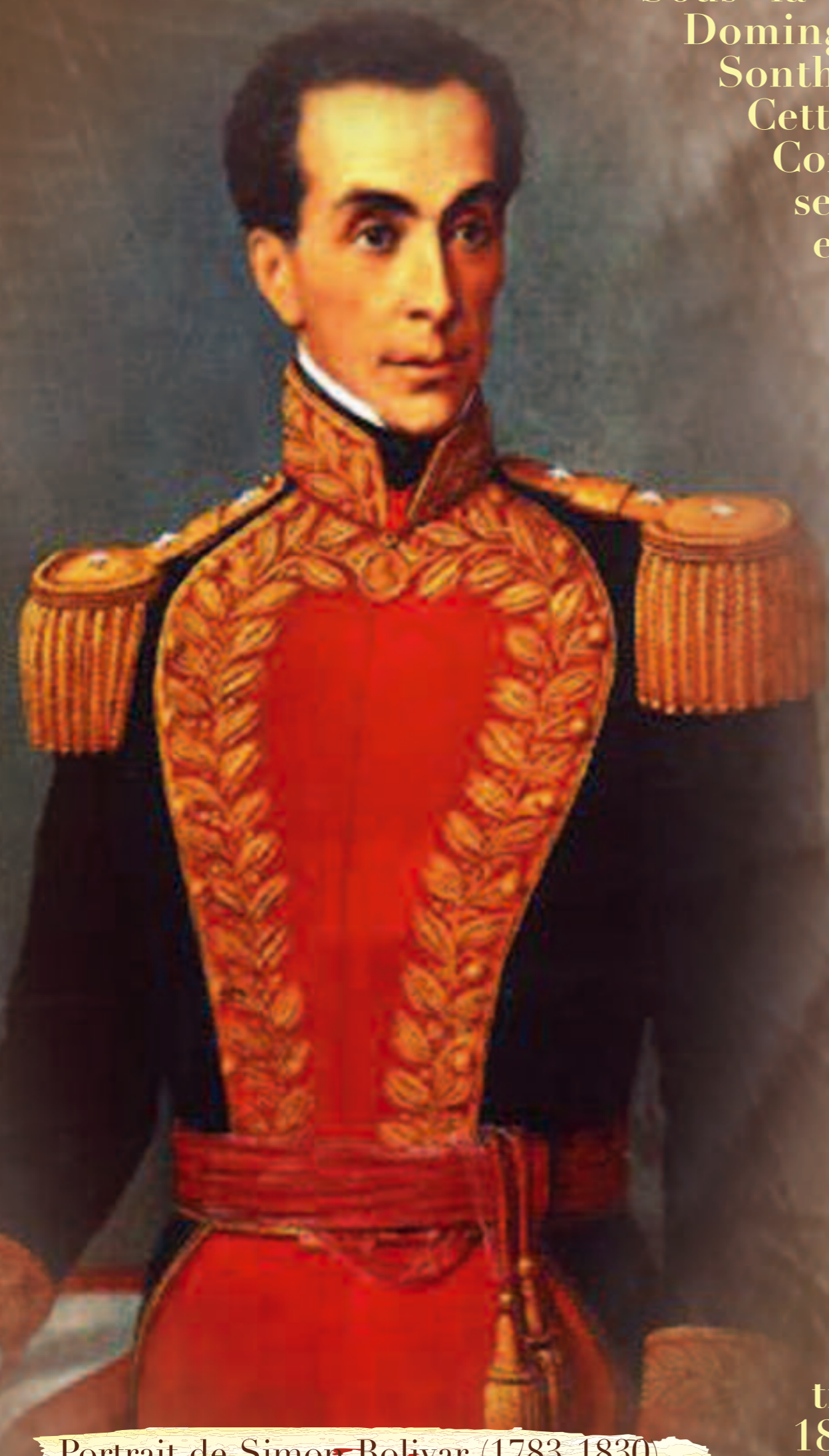
Portrait de Simon Bolivar (1783-1830)

Etats-Unis quelques mois plus tard, et qui l'imposa aux puissances européennes réunies pour le Congrès de Vienne de 1815.