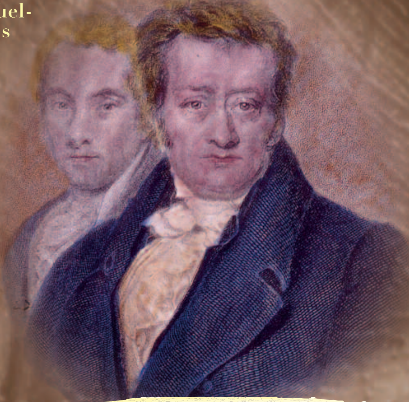
Portrait de William Wilberforce (1759-1833)

Problème national, le cheminement des Etats-Unis vers l'abolition fut long et douloureux. Ce fut pourtant ici que les premiers abolitionnistes les "quakers" condamnèrent la traite et l'esclavage à travers "la protestation de Germantown" en 1688. L'un des leurs, Benjamin Franklin l'un des pères fondateurs de la République américaine, organisa même la première société abolitionniste en 1785.