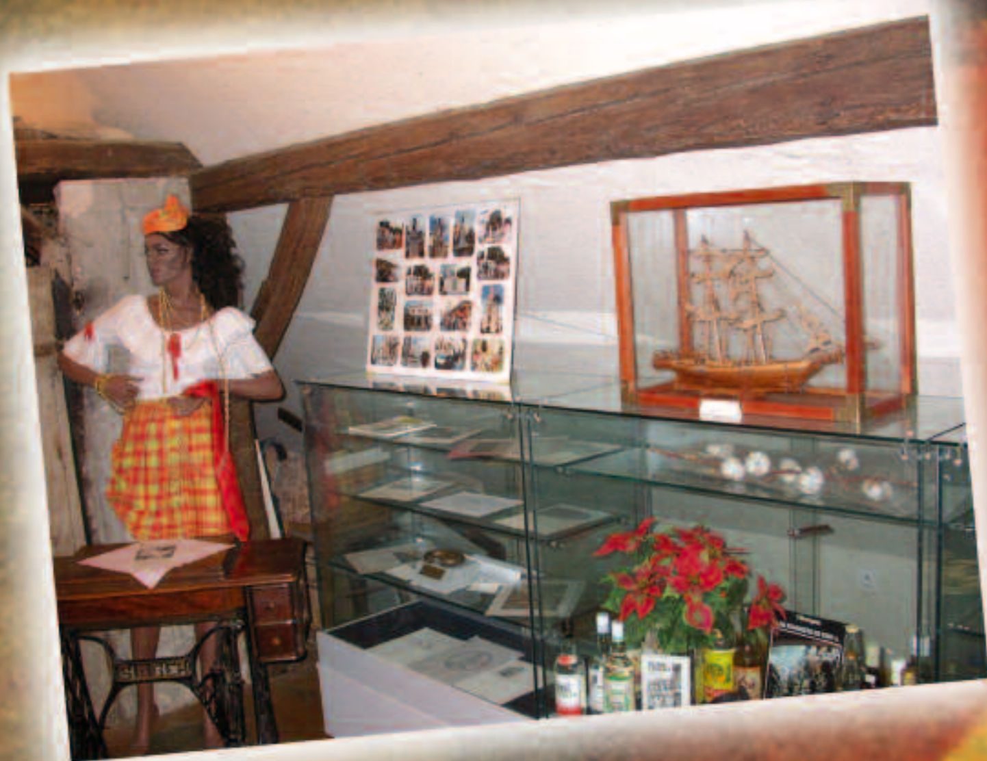
Vue de la Maison Schoelcher de Fessenheim

En parallèle, son combat pour les Droits de l'Homme s'étend : il milite pour l'amélioration du sort des femmes, lutte pour l'abolition de la peine de mort, défend la liberté de la presse, œuvre pour imposer la laïcité et préside un congrès anti-clérical.