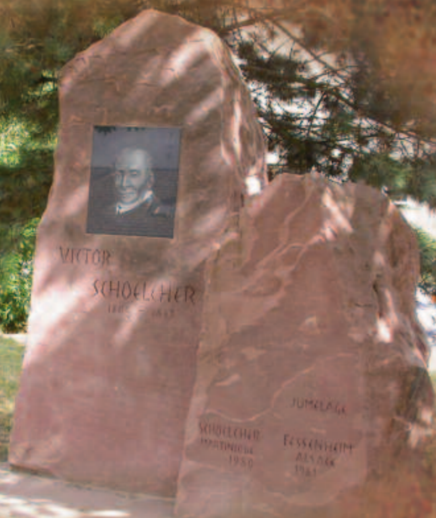
Stèle à la mémoire de Victor Schoelcher à Fessenheim

Pour honorer la mémoire de celui qui avait toujours manifesté la fierté de ses racines alsaciennes, un Musée lui est dédié à Fessenheim en 1982 avec le soutien de Gaston Monnerville, le petit-fils d'esclave guyanais devenu Président du Conseil de la République puis du Sénat.