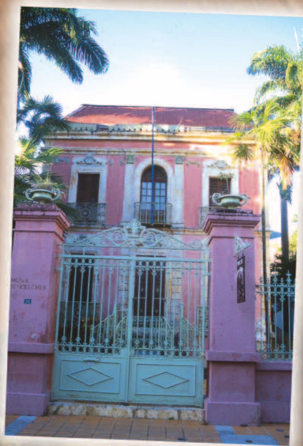
Musée Victor Schoelcher à la Guadeloupe.

Président de la Société de secours mutuel des Créoles il publie plusieurs ouvrages sur la législation du travail aux Antilles et poursuivra son combat pour le développement économique des Antilles.