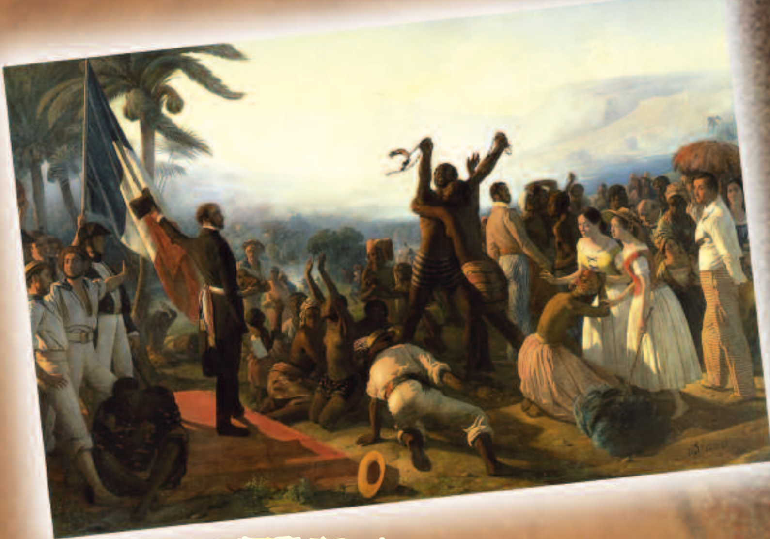
Scène de l'émancipation des esclaves le 27 avril 1848. Tableau de F. Biard.

Dans ses écrits, appuyés par l'observation tirée de ses voyages aux Antilles et en Afrique, il pose les principes et fondements d'un modèle de réorganisation sociale des colonies sans l'esclavage très empreint des théories du socialisme utopique de l'époque mais qui préfigurait et annonçait sous bien des aspects l'évolution des sociétés antillaises.