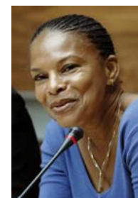
Chrisitane TAUBIRA sous réserve

Président de la Fondation «Education contre le racisme» Il est nommé ambassadeur de l'Unicef pour un programme de reconstruction des écoles ravagées par les séismes en Haïti