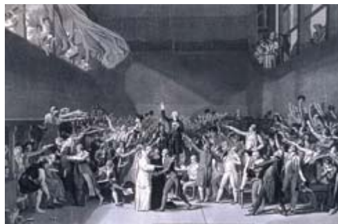
El « juramento del Jeu de Paume »

Gregoire será unos de los actores decisionarios en la unión del clero bajo y del Tercer-Estado, será presente durante el famoso « juramento del Jeu de Paume », rá presidir la Asamblea Nacional en este famoso dia del 14 de Julio de 1789, dia de la tomada de la Bastilla. Fue el quien redactó el acto de abolición de la Realdad que dejó el lugar para proclamar la República dia 22 de setiembre de 1792. Presidenciará la Convención nacional, será deputado n « les Cinq-Cents » y senador durante el Consulado y el Imperio. Votará contra el establecimiento del Imperio en 1804 y redactará el texto de exclusión del Imperador Napoleon Ier en 1814. Detestado por Napoleon Ier, vivirá el mismo tratamiento por partes de los tres reyes burbones de la restauración quienes lo excluiron de toda carga politica.