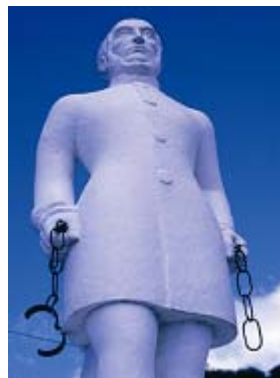
Estatua de Victor Schoelcher en la Martinica

Presidente de la Sociedad de Socorro de los Criollos publica varios volumenes sobre la legislación del trabajo y sigue el combate para el desarrollo económico de las Antillas.