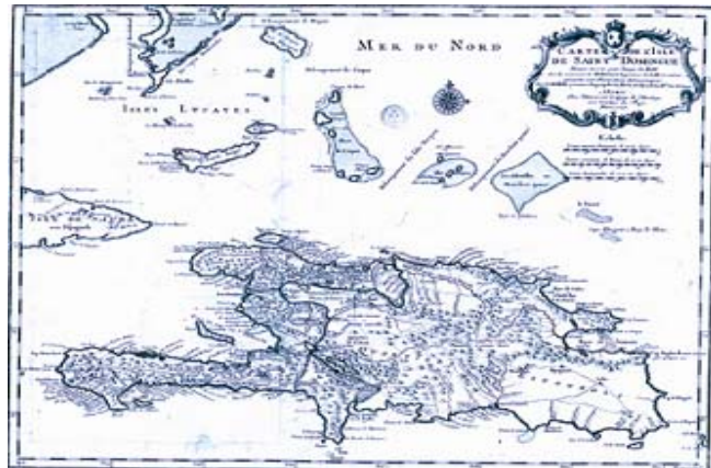
Mapa de la Isla de Santo-Domingo

Más de 30.000 plantadores manejando unas 8.500 empresas y más de 50.000 negros y mulatos libres explotan una situación económica en la cual trabajan 500.000 esclavos sin el menor derecho y totalmente excluido de la prosperidad de la colonia más rica de las Antillas.