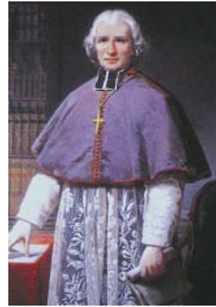
El Abade Gregoire

Defensor de los Negros, fue el protector de la joven república de Haïti : desde 1800 mantiene correspondencia para ayudar a Toussaint Louverture y en 1812 se ve invitado por el Rey Christophe. En 1819 Haïti abre una subscripción para poner un retrato de él en el palacio presidencial. En 1825 cuando los representantes de Haïti llegan en Paris para cobrar el reconocimiento de la independencia de su país por Francia se ven prohibido por las autoridades francesas ningún encuentro con Gregoire. Desafiando la interdicción oficial los haitianos irán se inclinar al pié de quien se había proclamado « el amigo de los hombres de todos los colores ».