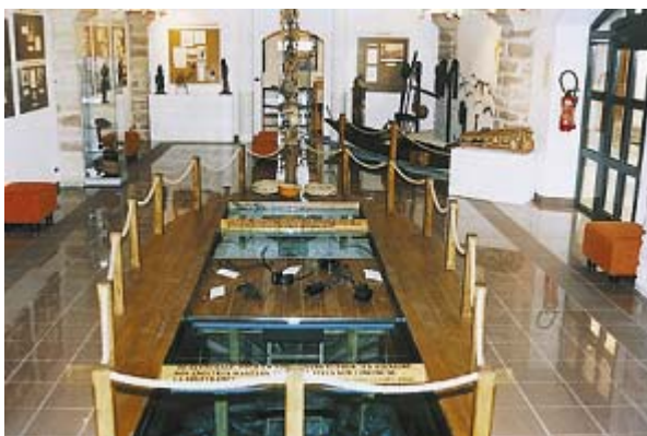
La Casa de la Negritud y los Derechos Humanos en Champagney

- en la ira de los justos de Champagney se encuentra no soló los principios filosóficos condenando la esclavitud tal como lo hicieron los grandes intelectuales de la epoca, sino tambien los motivos al boicot economico.