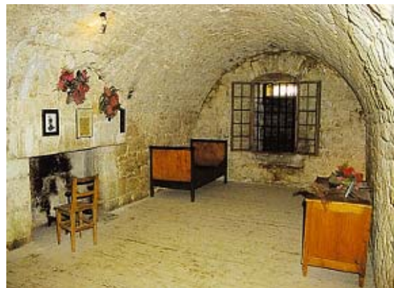
Carcel de Toussaint Louverture

Napoleon I conoció su primera derrota en Santo Domingo. En 1817, en el memorial de Santa Helena, reconoció su error : « el asunto de Santo Domingo fue una gran tontería de mi parte. Fue el mayor error que he cometido en administración. Habria debido tratar con los jefes Negros como las autoridades de una provincia, dejar como Vice-Rey Toussaint Louverture ». Apreciable homenaje del « Napoleon Blanco » a quien fue sobrenombrado el « Napoleon Negro » por el famoso escritor Chateaubriand.