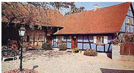
La Casa Victor Schoelcher en Fessenheim

Por la ocasión del Centenario de la abolición de la esclavitud, us ultimos restos son transferidos en el Panteon Nacional en Paris. En el mismo tiempo entra Felix Eboué, descendiente de esclavo, gobernador de la Africa Equatorial Francesa y primer Resistante del Imperio raliado al General de Gaulle.