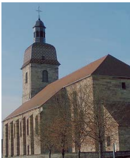
La iglesia de Champagney

En las vísperas de la Revolución, Champagney es un pueblito de « doscientos fuegos » en donde viven hogares humildes: paisanos, menores, madereros... que saben lo que es trabajar muy duro, con pena y sufrir en una tierra pobre abajo de un clima muy rigoroso.