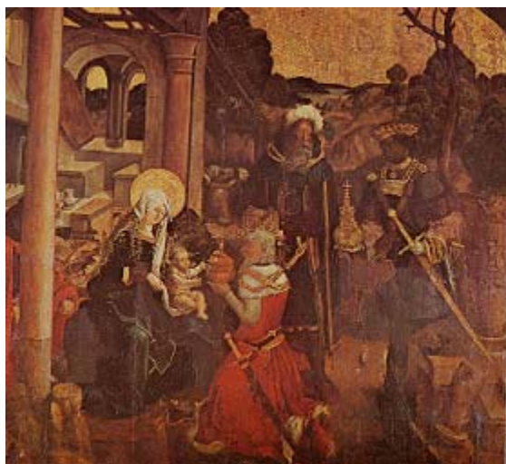
Cuadro de la adoración de los Reyes Magos

En el gris de su vida cotidiana, los habitantes de Champagney tienen sin embargo un motivo de fealdad: su iglesia nueva en donde se reúnen y que en su salida se vuelve un lugar en donde debaten de las ideas y decisiones a tomar para la comunidad. El invierno de 1788-89 ha sido terrible: a la falta de alimentos y al frío se añadieron los impuestos y las corveas. Por eso, cuando el cura les pide que se reúnan para que redacten su Cuaderno de Quejas, van a responder a esta llamada.