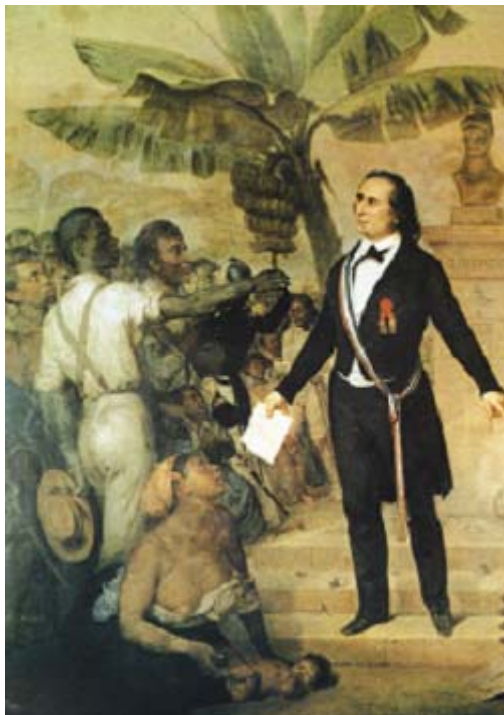
Declaración de la abolición de la esclavitud en las colonias

En sus escritos, apoyados por la observación vivida durante sus viajes en las Antillas y Africa, planea los principios y fundamentos de un modelo de reorganización social sín esclavitud y empaado de las teorías del socialismo utopico de la epoca y en el cuál ya se prefiguraba en varios aspectos la evolución de las sociedades de las Antillas.