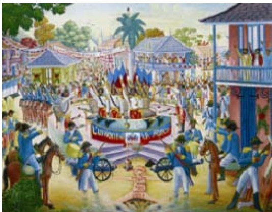
Cuadro de Freddy Cherasard : « 1 er de Enero de 1804 : independencia »

Cuando el Negro Toussaint apareció por primera vez en el teatro político « ya estaban nasciendos varios movimientos de emancipaciones : el de los colonos blancos por la autonomia y la libertad comercial, el de los mulatos para la igualdad social, el de los negros esclavos hacia la libertad. Cuando Toussaint Louverture vino, fue para acompañar , unir y llevar a cabo esos movimientos, para mostrar que no hay raza paria, que no hay paises marginales, que no hay pueblos de excepción. Se le habian legado bandas de esclavos. Con ellas, hizo un ejercito. Se le habian dejado una revolta. De esa, hizo una Revolución. Se le habian dejado una población. Con ella, hizo un pueblo. Se le habian dejado una colonia, de esa hizo un Estado y mejor, una Nación » (Aime Césaire).