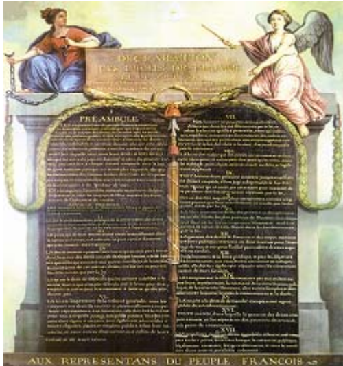
Declaración de los Derechos Humanos

Más allá de una carrera política inmensa, Gregoire va a dejar una obra considerable : fue el autor de la supresión de la gabelle, el impuesto más detestado del pueblo, o del derecho del hijo mayor. Dirigirá las reformas de la instrucción pública, instaurará las medidas de lucha contra el vandalismo, irá a criar la « oficina de las Longitudes », universalizará el idioma francés. Será el fundador de las casas de agricultura departamentales, del Instituto de Francia, de la Academia de las Ciencias Morales y Políticas o del Conservatorio de los Artes y Profesiones.